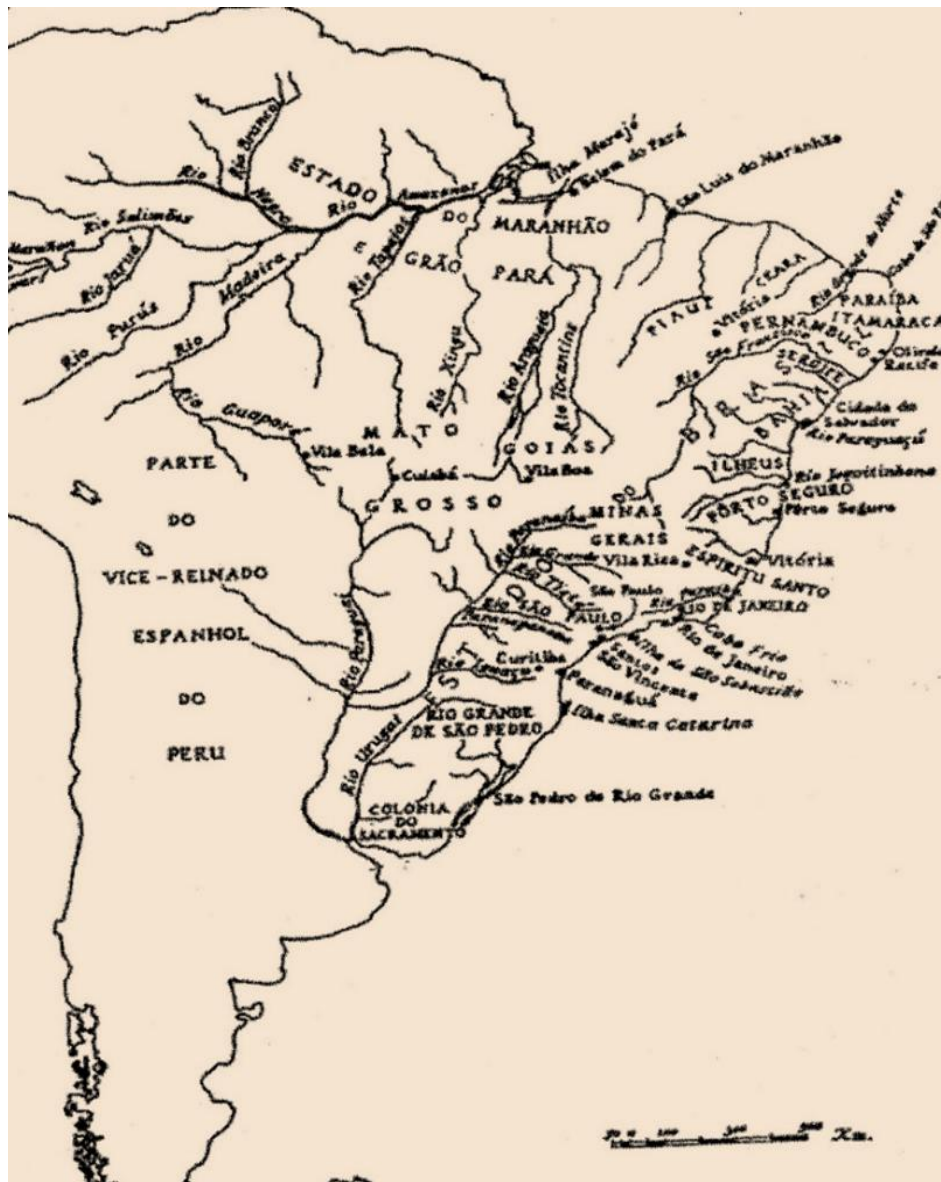
Estado do Brasil e Estado do Maranhão e Grão-Pará em 1750 32 .